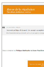
TABLE OF CONTENTS : Financialisation, income distribution and the crisis - DANY LANG • The demands of finance and the glass ceiling of profit without investment - LAURENT CORDONNIER & FRANCK VAN DE VELDE • Unemployment, working time and financialisation: the French case - MICHEL HUSSON • Finance-dominated capitalism and re-distribution of income: a Kaleckian perspective - ECKHARD HEIN • Rising inequality as a cause of the present crisis - ENGELBERT STOCKHAMMER • Europe's Hunger Games: Income Distribution, Cost Competitiveness and Crisis - SERVAAS STORM & C.W.M. NAASTEPAD.

OXFORD UNIVERSITY PRESS • VOL 39 • N°3 • MAI 2015 • ISSN : 0309-166X • 284 p.